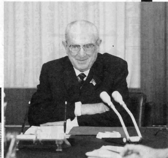
アンドロポフ書記長。1983年、クレムリンで。

れた。88年のアルメニア大地震は死傷者数万人と30%の家屋倒壊、原発2基の停止など、人道上および経済上の問題を引き起こした。ゴルバチョフは個人として、彼が85年に始めた反アルコールキャンペーンの失敗を咎められても致し方ない。