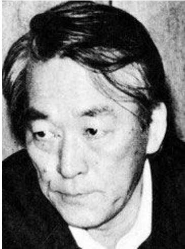
△『労働組合のロマン』（労働旬報社、1986年）表紙写真